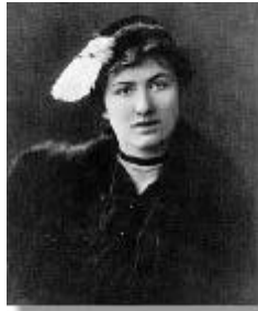
Edith Södergran 1892 - 1923 (Siehe Seite 5)